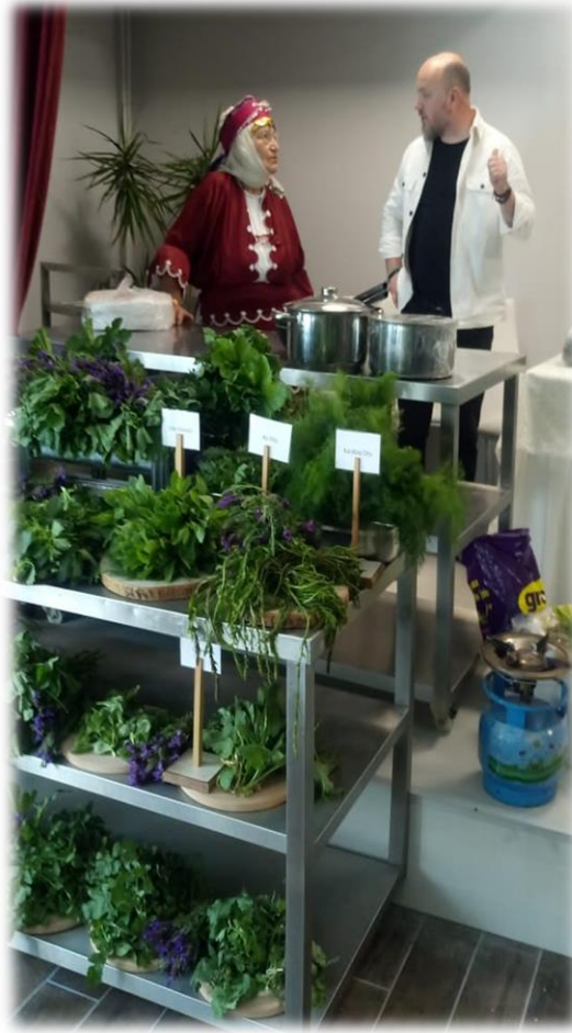
Kültürel Miras / Bitkiler Üzerine Söyleşi