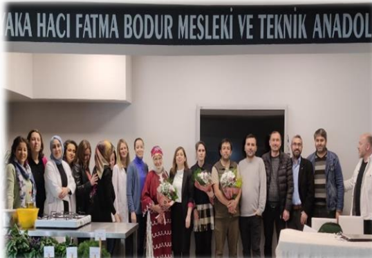
Program Sonrası Hatıra Fotoğrafımız