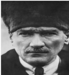
"Bir ulus, simsıkı birbine bağlı olması bildiği yeryüzünde onu dağıtabilecek bir güç düşünülemez." M. Kemal ATATÜRK

"Bir yurdun en değerli varlığı, yurttaşları arasında millî birlik, iyi geçişme ve çalışkanlık duygusu ve kabiliyetlerinin olgunluğudur. Ulus varlığını ve yurt erginliğini korumak için bütün yurttaşlarını canını ve her şeyini derhal ortaya koymaya karar vermiş olması, bir ulusun en yenilmez silâhı ve koruma vasıtasıdır. Bu sebeple Türk ulusunun idaresinde ve korumasında millî birlik, millî duygu, millî kültürün en yüksekte göz diktiğini"